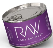
Da domani fino a sabato 26 ottobre Rome Art Week 2024 arte contemporanea in città

di supportare i ragazzi autistici, quest'anno l'evento vede un'ulteriore crescita grazie alla collaborazione con l'associazione Di.Di. Diversamente Disabili e il progetto " Aracne – La Rete che Include ". Sarà una giornata interamente dedicata al divertimento e alla solidarietà, ricca di attività emozionanti e formative, che si svolgerà dalle 9:00 alle 17:00 con ingresso gratuito.