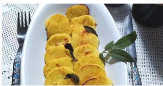
Le ricette della tradizione romana: " Gnocchi di semolino " by Silvy